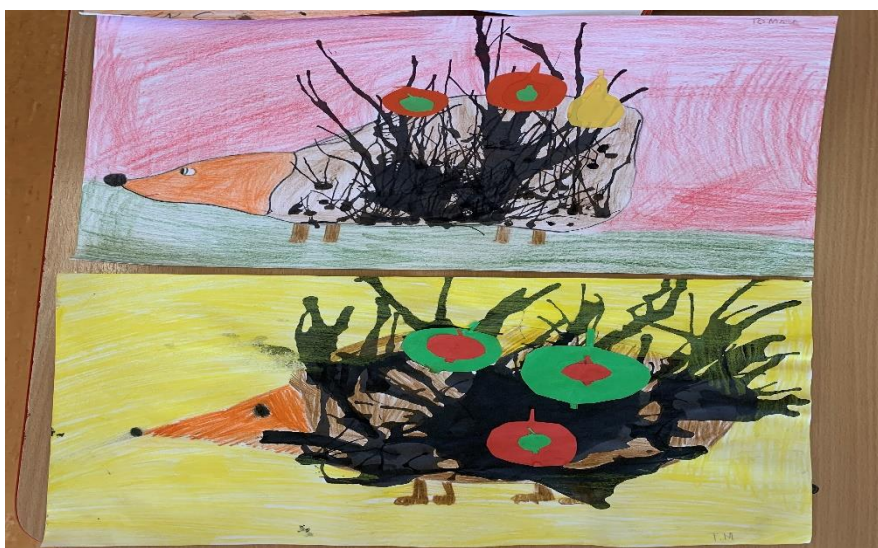
Kresby: žiaci 3. roč. ZŠ