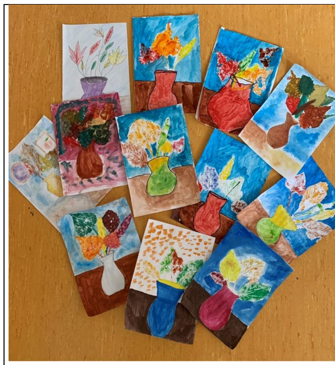
Jesenné maľovanie: Žiaci 6. roč.